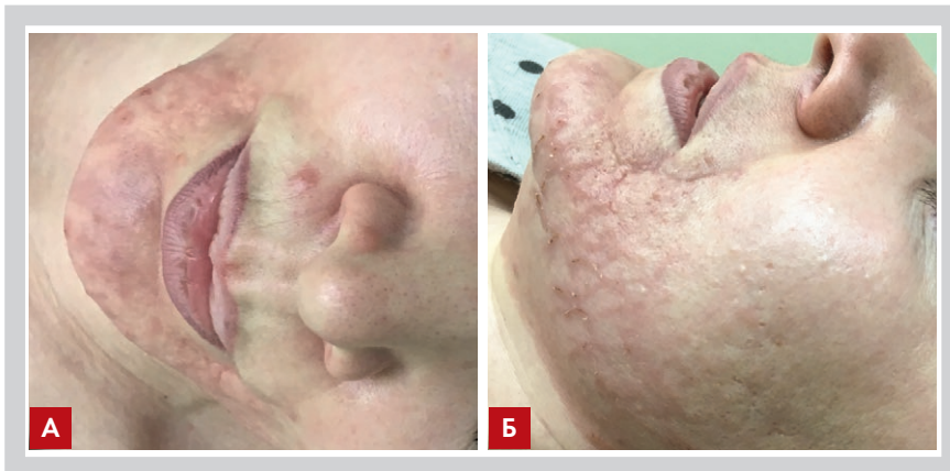
Рис. 4 (А и Б). Осложнения после процедуры ФФТ