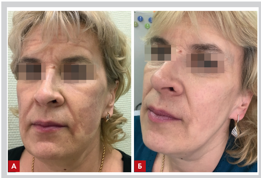
Рис. 6. Клинический случай 1: до начала лечения (А) и положительная динамика на фоне проведенной терапии (Б)