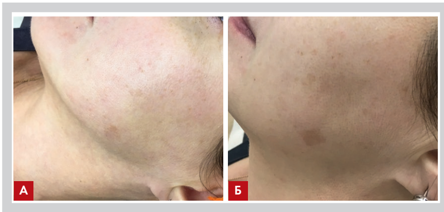
Рис. 2. Усиление выраженности гипермеланоза после лазерного воздействия с целью коррекции участка гиперпигментации: до (А) и после (Б) процедуры

Поствоспалительная гиперпигментация (ПВГ), или поствоспалительный гипермеланоз, – часто встречаемое в практике врача состояние, характеризующееся увеличением продукции и депонирования меланина после воспалительного процесса в коже (механическая травма, акне, трение, раздражающий дерматит, экзематозный дерматит, простой хронический лишай, псориаз, розовый лишай, фиксированная токсикэритема, плоский лишай, герпетиформный дерматит, lupus erythematosus и др.). Она может возникнуть в результате лазерной терапии, дермабразии, криотерапии, химических пилингов (рис. 1, 2).