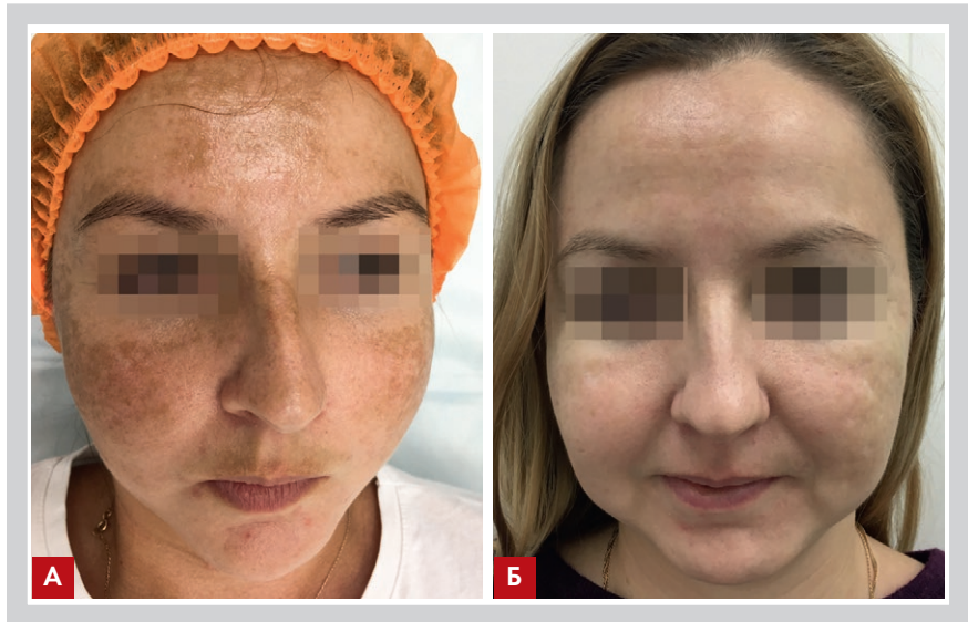
Рис. 7. Клинический случай 2: появление обширных гиперпигментированных очагов в области лица после поездки в зону активной инсоляции (А) и положительная динамика на фоне проведенной терапии (Б)

Пациентке была предложена монотерапия препаратом CURACEN на основе гидролизата плаценты человека. Препарат вводился в папульной технике и в технике напаж в области гиперпигментации наноиглой 34Gx0,4 мм. Курс лечения состоял из 5 процедур 1 раз в неделю, аппликационная анестезия не применялась. На фоне монотерапии наблюдалось значительное осветление участков гипермеланоза, уменьшение контрастности границ зон поражения (рис. 7Б).