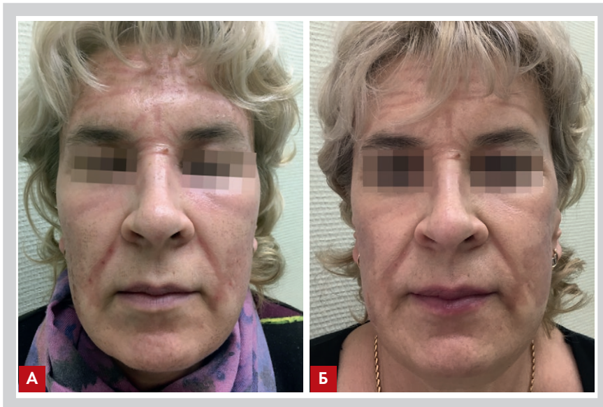
Рис. 5. Клинический случай 1: 4-й день после фракционного абляционного воздействия (А) и появление участков поствоспалительного гипермеланоза на второй неделе (Б) после процедуры